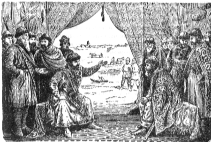
Владимир Мономах на совете князей.

тый скот. Однако Владимир не позарился на обещаемые богатства и заявил знатному половцу: «Ты много раз клялся не воевать, но продолжал разорять русскую землю. Почему ты не учил сынов своих и род свой соблюдать клятвы, а все проливал кровь христианскую? Да будет теперь кровь твоя на голове твоей!» И приказал князь казнить хана. Пора уговоров отходила в прошлое. Надвигалось неотвратимое возмездие за грабительские походы на мирное население Руси. С этого победоносного похода началась слава Владимира Мономаха, как признанного руководителя русских войск в походах против половецких орд.