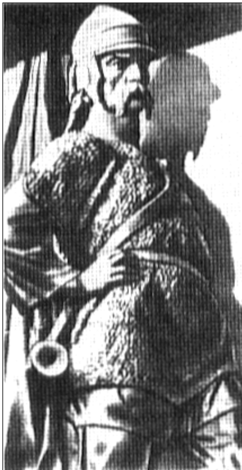
Святослав Игоревич, великий князь киевский. Фрагмент памятника «Тысячелетие России»