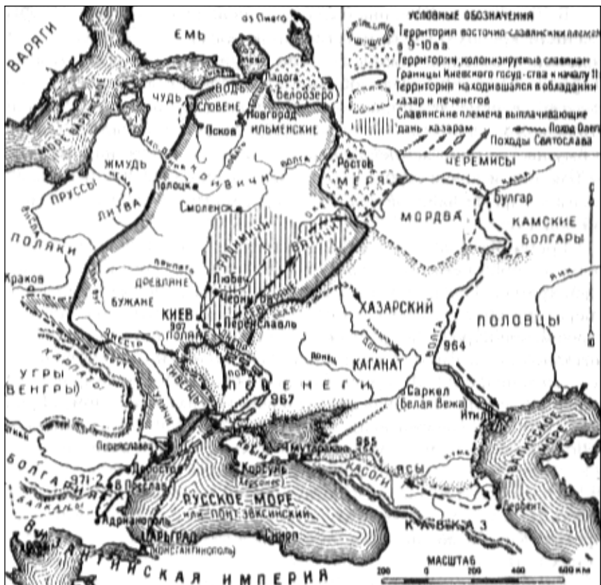
КИЕВСКОЕ ГОСУДАРСТВО В IX—XI ВВ.

ториальные объединения: вотчины-княжества, которые стали передаваться по наследству. Такой порядок распределения земель таил в себе угрозу будущего разъединения огромного государства. Князья-вотчинники стремились закрепиться в своих владениях и отделиться от центра — Киева.