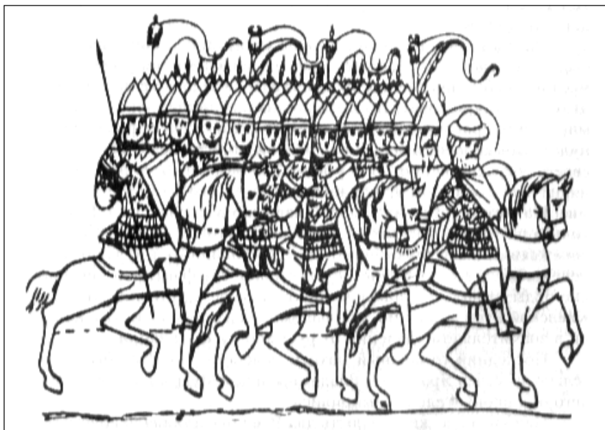
Дружина князя Бориса Владимировича возвращается из похода против печенегов. Миниатюра из летописи XIV века

справедливости следует отметить, что в те времена на поединок сходились и предводители войск. Так, Мстислав Тмутараканский (брат Ярослава Мудрого) принял вызов касожского богатыря князя Редеди и победил его. С тех пор в войске Мстислава появились воины-черкесы, а одна из династий русских князей называлась редедичами. В русских устных сказаниях о борьбе с кочевниками героями сражений часто оказывались простые люди — крестьянские сыны Илья Муромец, Микула Селянинович и кожевник Никита (Ян) Кожемяка. Народ осознал, что только с его помощью могут киевские князья справиться с любым опасным противником.