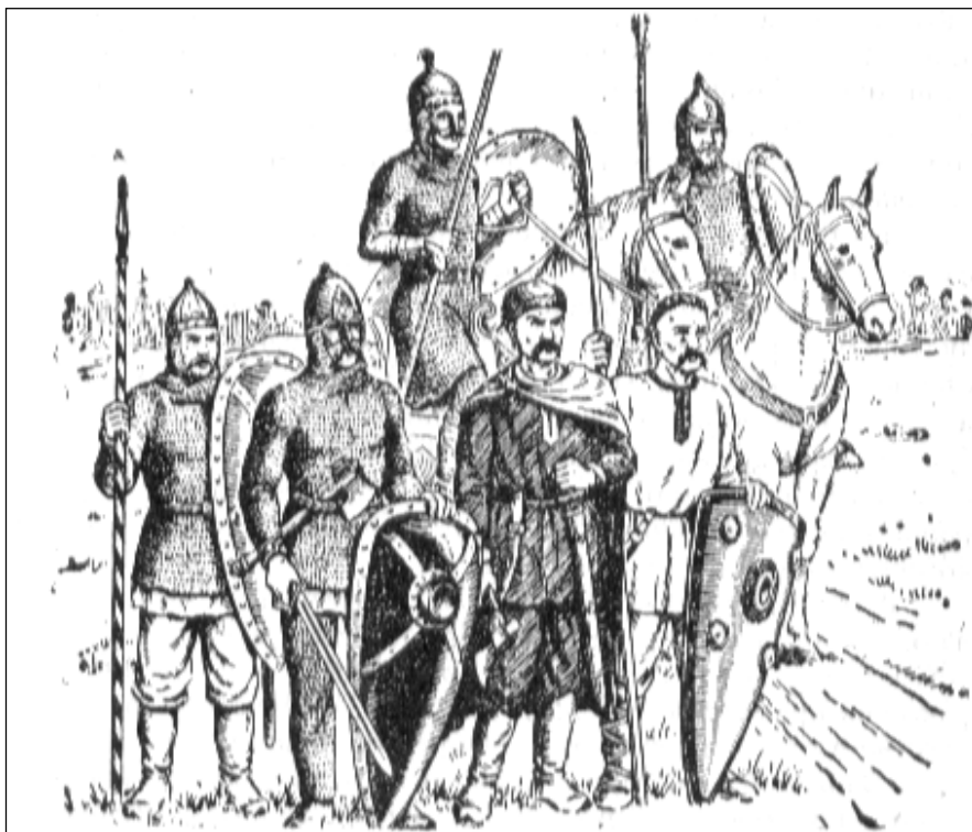
Воины Древнерусского государства.

представлял собой лук, который был прикреплен к деревянной ложе, снабженной приспособлением для выбрасывания стрел из особого желоба.